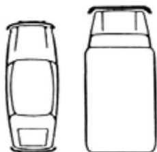
Grafico dell'incidente al momento dell'urto

Indicare i danni visibili al veicolo INDN S.r.l